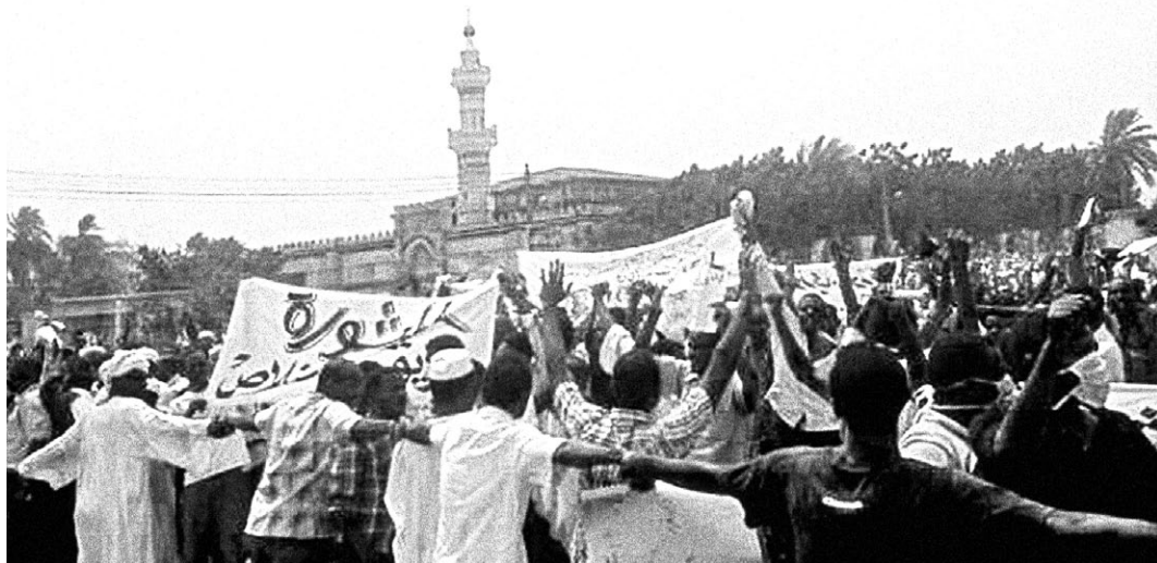
Demonstration in Wad Nubawi, Omdurman, Sudan, im Juni 2012