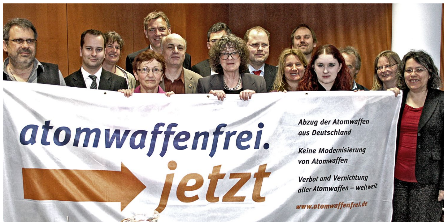
Abgeordnete aus allen Fraktionen stehen hinter den Kampagnenforderungen, Frühstücksgespräch im Bundestag März 2012

jetzt« will erreichen, dass die Politiker und Parteien Flagge zeigen für eine atomwaffenfreie Welt, für den Abzug und die Verschrottung der Atomwaffen statt deren Lebenszeitverlängerung.