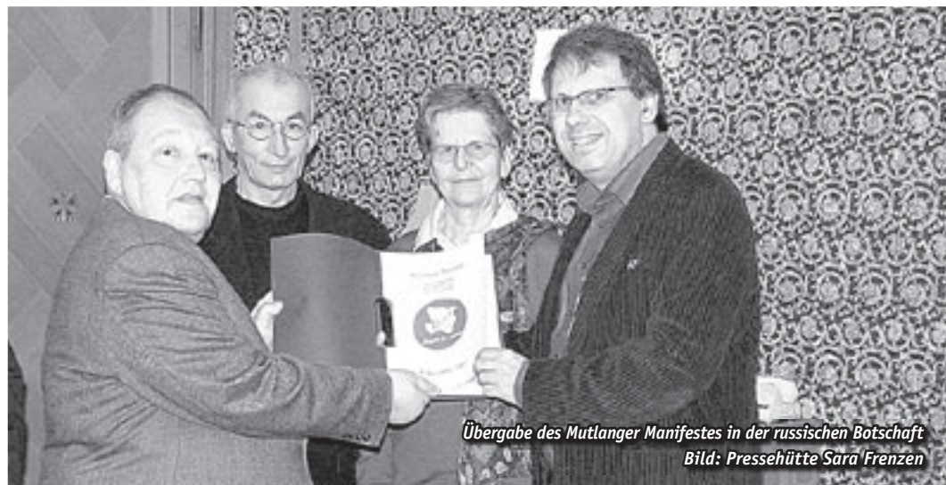
Übergabe des Mutlanger Manifestes in der russischen Botschaft