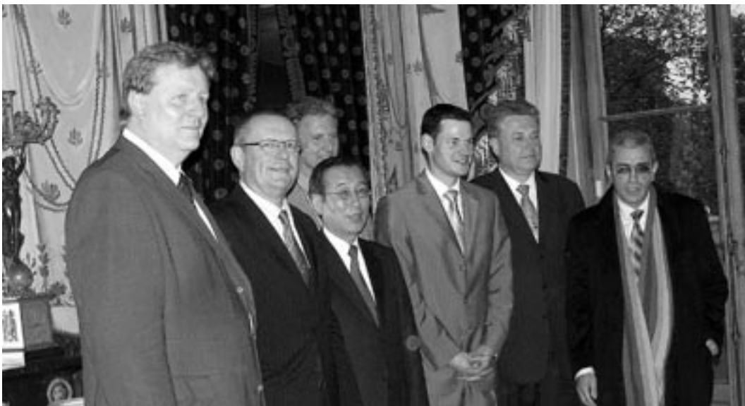
Die Delegation der Mayors for Peace - Der Empfang durch die Stadt Genf schuf eine gute Möglichkeit zu informellem Austausch zwischen den Bürgermeistern und Diplomaten

Der Focus berichtete als erster, dass nach einer Untersuchung des US-Verteidigungsministeriums die Lagerung der US-Atomwaffen in Europa Sicherheitsmängel aufweist und dass Oppositions- und SPD-Politiker deren Abzug fordern. Namentlich wird Büchel in dem Bericht erwähnt. Hans M. Kristensen von der Federation of American Scientists hat den Bericht ausfindig und dann öffentlich gemacht. Diese Nachricht schaffte es dann in Zeitungen und in die Tagesschau. Zeitgleich erschien in der TAZ eine Ankündigung der Aktionswoche beim Bücheler Fliegerhorst: Nuklearer Countdown in der Eifel Konsequenzen aus dem Bericht des US-Verteidigungsministeriums könnten sein, dass die Atomwaffen in Europa auf „sichere Standorte“ konzentriert werden. Die Feststellung der unsicheren Lagerung bietet aber auch ein Argument für einen Abzug ohne politische Implikationen, einfach aus Sicherheitsgründen. Wir werden im nächsten FreiRaum ausführlich berichten.