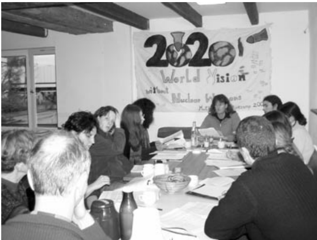
Seminar in der Pressehütte