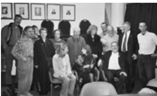
TeilnehmerInnen der Strategietreffen Abolition 2000 Europe