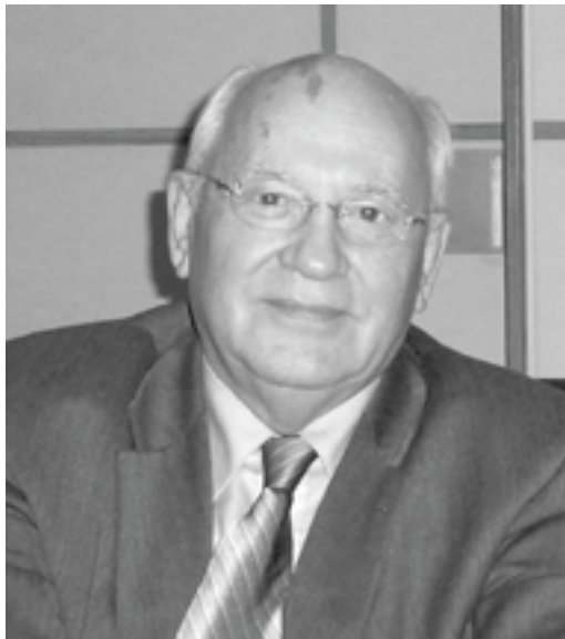
Gorbatschov in London

Der frühere Sowjetpräsident warnte „früher oder später wird es katastrophale Folgen haben, wenn Atomwaffen existieren. Sie können in die Hände von Terroristen fallen.“ Die vollständige Abrüstung der Atomwaffen zu verlangen sei nicht naiv, sondern notwendig. Als er 1986 die Verschrottung der Atomwaffen gefordert habe, hätte es zwei Reaktionen gegeben, das Abrüstungsangebot als reine Propaganda abzutun oder als Illusion darzustellen. „Aber wir waren in der Lage, ganze Klassen von Atomwaffen abzuschaffen.“ wsh ●