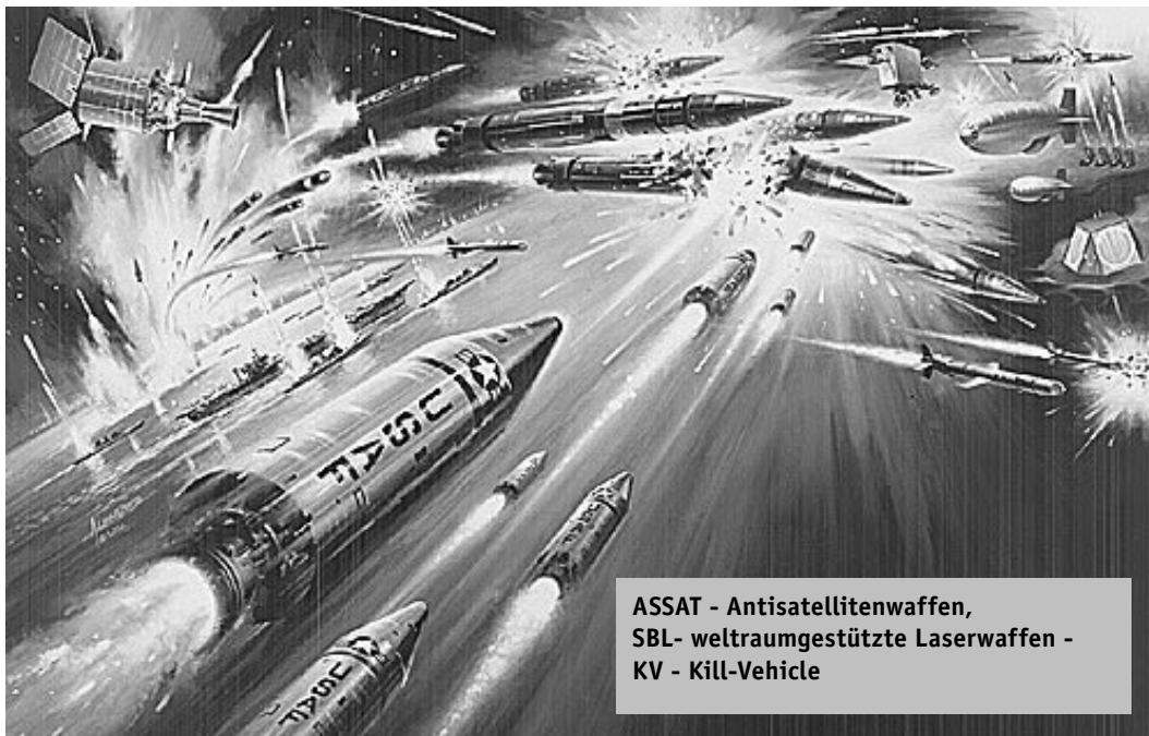
ASSAT - Antisatellitenwaffen, SBL - weltraumgestützte Laserwaffen - KV - Kill-Vehicle

Quellen & Informationen: www.basicint.org/nuclear/NMD/2004demos.htm , www.hsfk.de/abm/forum/meads.htm