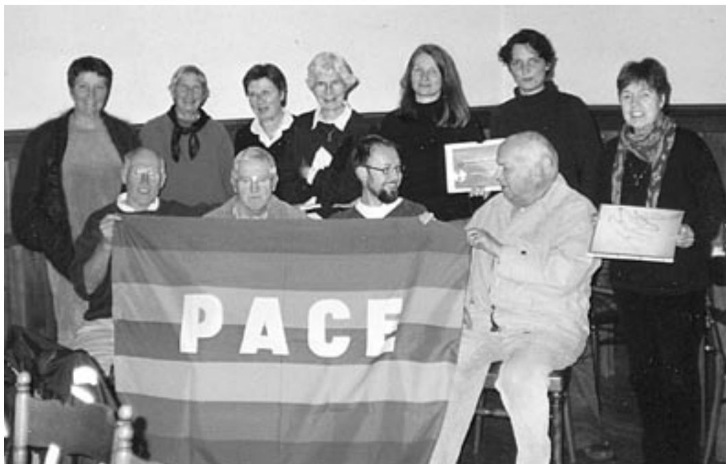
TeilnehmerInnen der GAAA Jahrestagung